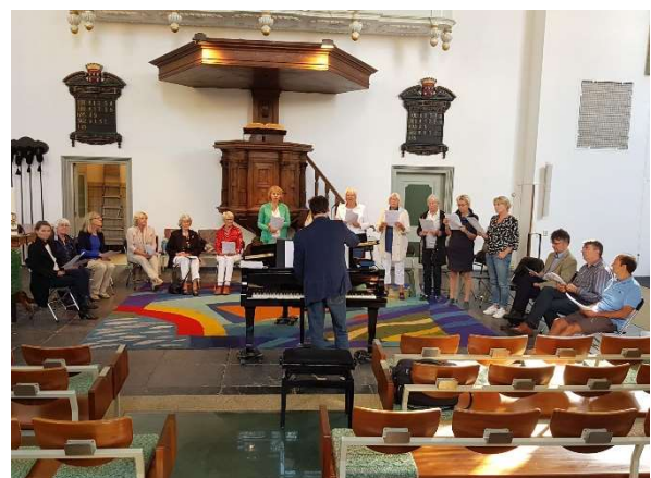
De zangworkshop in de middag.