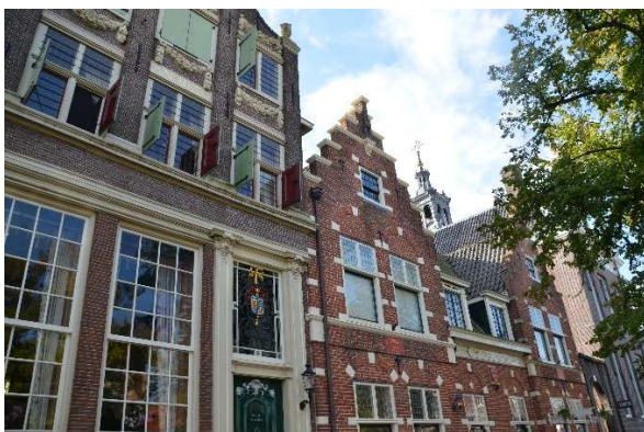
Gevels in Edam.

Na afloop evalueerden we de dag onder het genot van een drankje in de Prinsenbar.