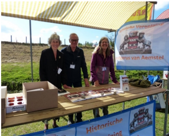
De kraam van de Vereniging op de markt in Waver op 11 augustus.