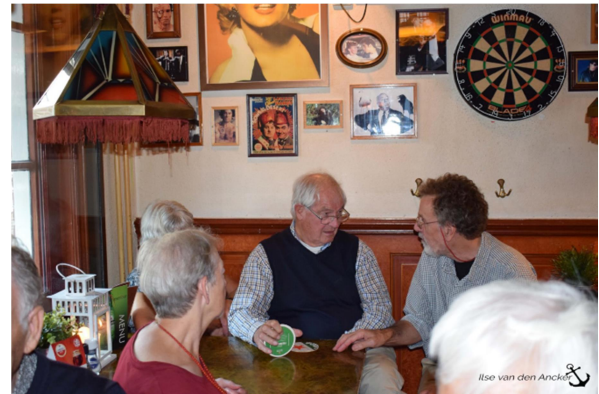
Nog even napraten aan het eind van de excursie.