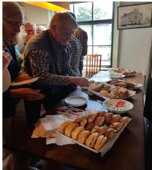
De lunch in het museum.