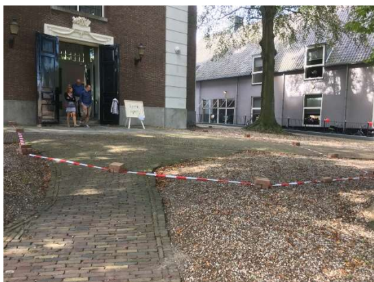
Impressie van Open Monumentendag 2018.