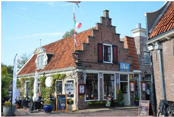
Restaurant De Fortuna, Edam.

Voor we de kerk ingingen, werd de Librye (of Bibliotheek) van buitenaf nader toegelicht. In de kerk was het eerste deel - voor liefhebbers - de beklimming van de kerktoren. Daarbij waren de twee kerkklokken goed te zien. Boven gekomen, konden we langs een smalle galerij genieten van het uitzicht. Zie ook: www.grotekerkedam.nl