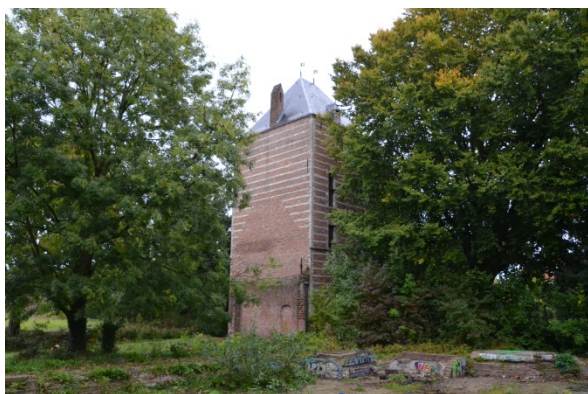
Toren van Kasteel van Van Aemstel, dertiende eeuw.

We liepen vervolgens rond de vierkante vestingtoren uit 1530, restant van het kasteel dat in 1279 in bezit was van Gijsbrecht van Aemstel. Onze gids vertelde hoe de HKIJ door tussenkomst van koningin Beatrix heeft kunnen voorkomen dat het gebied rondom de toren bebouwd zou worden. Daardoor is noch steeds duidelijk wat de oorspronkelijke omvang was van het terrein waarop het kasteel heeft gestaan. De HKIJ streeft er naar om de contouren van het toenmalige kasteel blijvend zichtbaar te maken, zoals in Ouderkerk de archeologische werkgroep de contouren van de middeleeuwse kerk op de plaats van de huidige monumentale Amstelkerk, blijvend zichtbaar wil maken in de bestrating en het grind.