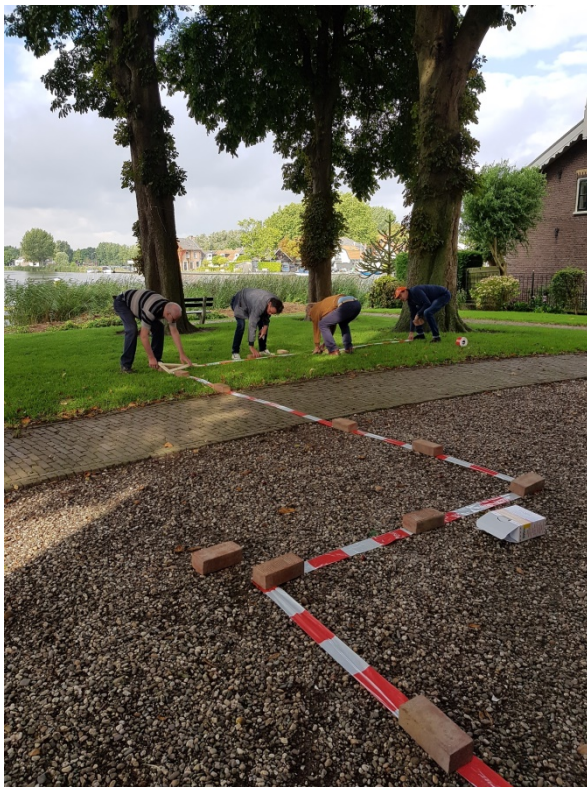
Leden van de werkgroep aan het werk.

Op de locatie van de huidige Amstelkerk stond in de middeleeuwen al een kerk. Tijdens de Open Monumentendag op 10 september jl. hebben de leden van de archeologische werkgroep op basis van archeologisch onderzoek de precieze ligging gereconstrueerd. Op de kerkheuvel kon men het exacte grondpatroon terugzien. De Middeleeuwse voorganger van de huidige Amstelkerk heeft zo'n 500 jaar op de kerkheuvel gestaan, tot hij in 1773 werd afgebroken. In 1952 en 1961 heeft er archeologisch onderzoek plaatsgevonden waarbij een deel van de fundering van die middeleeuwse kerk in kaart is gebracht. Op basis van opmetingen die toen zijn gedaan, van schilderijen en prenten van de voorganger van de Amstelkerk, hebben de leden van de werkgroep Archeologie een compositietekening gemaakt van hoe de plattegrond van die middeleeuwse kerk eruitziet ten opzichte van die van de huidige Amstelkerk. Tijdens de Open Monumentendag van zondag 10 september 2017 is van 12:00 tot 16:00 uur het grondpatroon van de middeleeuwse kerk tijdelijk