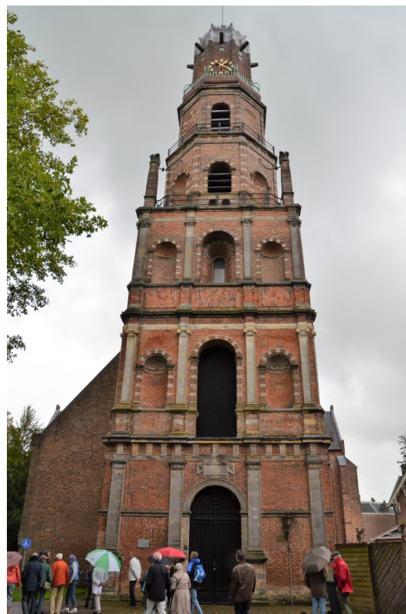
De excursie bij de Sint Nicolaaskerk.

Bart Rietveld ging ons met gepaste trots voor naar het oude Waaggebouw waar de HKIJ sinds 1989 beschikt over vergader-, documentatie- en verkoopruimte. Het Waaggebouw werd in 1779 gebouwd op de plaats waar de vorige Waag stond. Na De Waag hebben we in het hotel-restaurant onder genot van een drankje, nog wat nagepraat over alles wat we deze dag hebben gezien. IJsselstein is veel meer dan een Vinexplaats en te mooi om langs de A2 alleen maar aan voorbij te rijden