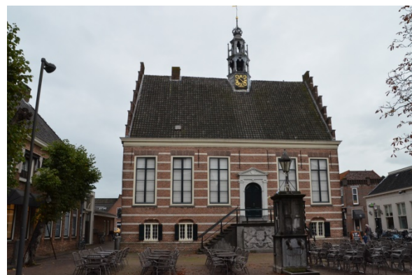
Historisch stadhuis van IJsselstein (zestiende eeuw).

Bart Rietveld ging ons met gepaste trots voor naar het oude Waaggebouw waar de HKIJ sinds 1989 beschikt over vergader-, documentatie- en verkoopruimte. Het Waaggebouw werd in 1779 gebouwd op de plaats waar de vorige Waag stond. Na De Waag hebben we in het hotel-restaurant onder genot van een drankje, nog wat nagepraat over alles wat we deze dag hebben gezien. IJsselstein is veel meer dan een Vinexplaats en te mooi om langs de A2 alleen maar aan voorbij te rijden