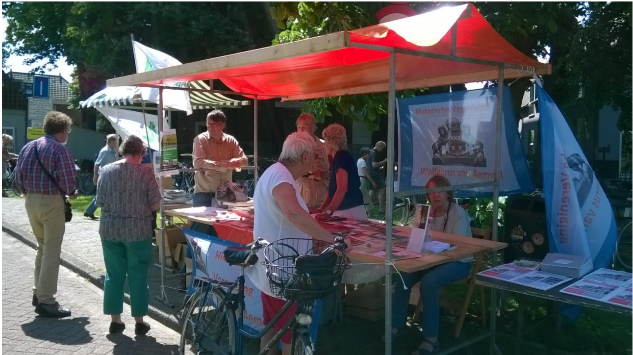
De kraam van Wolfgerus van Aemstel, museum Ouder-Amstel en Beth Haim.

Beth Haim. De stand mochten we lenen van het Oranjecomité. De uitgebreide documentatie en diverse publicaties van Wolfgerus, waaronder Speuren en Ontdekken, mochten zich verheugen in grote belangstelling van bezoekers op de fiets of te voet.