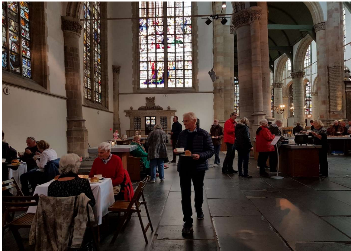
Lunch in de Grote Kerk van Gouda: foto: Joke Alink