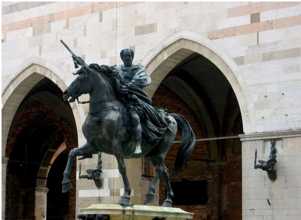
Ranuccio Farnese te paard in Piacenza in 'Helden' op hengsten. Verhalen over ruitersstandbeelden'.