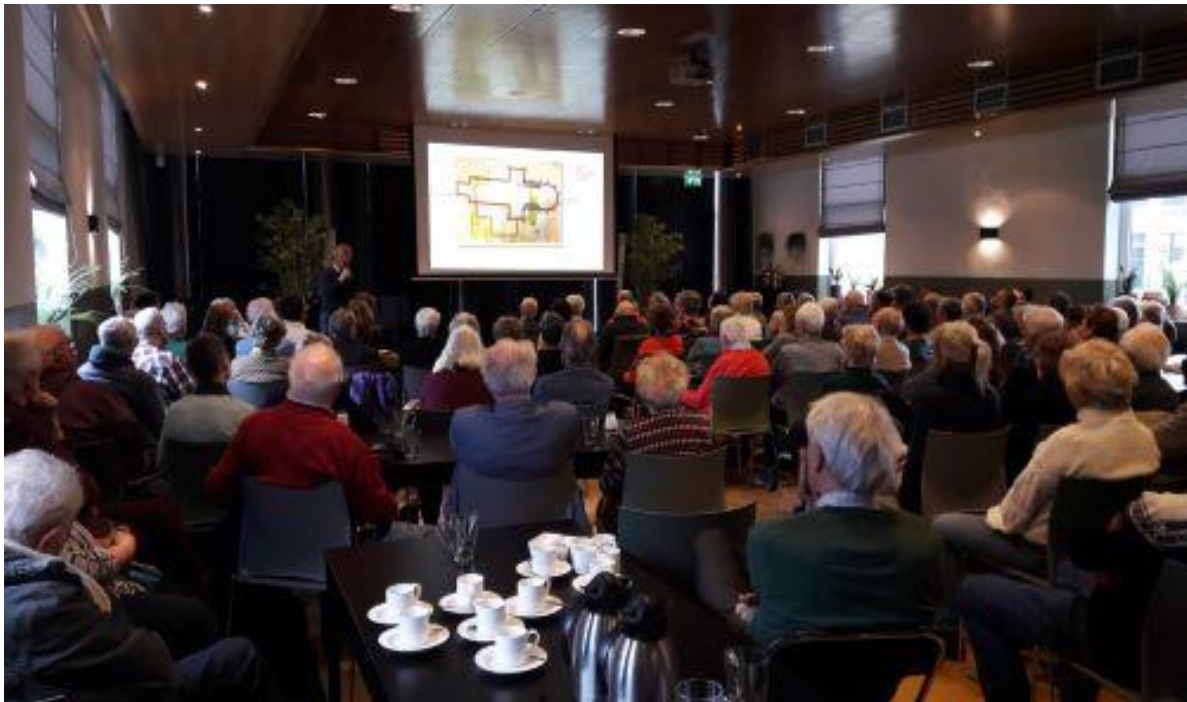
Impressie van de voordracht op 23 februari 2020 in de Amstelstroom