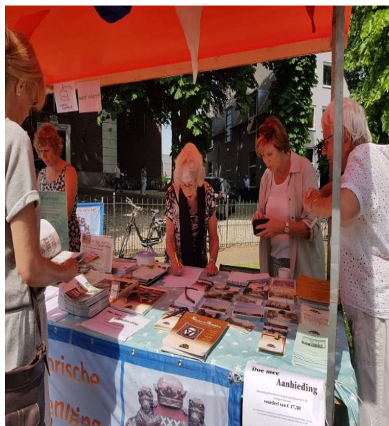
Ria op de Amstellanddag van 2 juni jongstleden