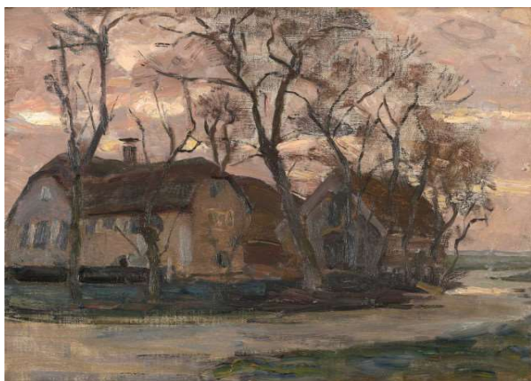
Piet Mondriaan [1872-1944], Boerderij Weltevreden, Duivendrecht, circa 1905. Gemeentemuseum Den Haag

In voorgaande jaren hebben wij in het najaar steeds prachtige wenskaarten laten drukken. Een van de beroemdste Nederlandse schilders, Piet Mondriaan (1872-1944), vooral bekend van zijn kubistische schilderijen, schilderde in het begin van de twintigste eeuw nog veel figuratief, onder andere aan het Gein en in Duivendrecht: boerderijen, bomen, molens. Het Gemeentemuseum in Den Haag heeft van hem een grote collectie. De afbeelding die gekozen is voor de wenskaart van 2019, is een voormalige boerderij in Duivendrecht: Boerderij Weltevreden.