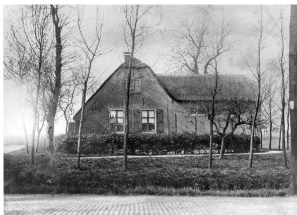
Boerderij Weltevreden in de winter, begin 1923.

De boerderij lag, vanaf de Duivendrechtse brug gezien, aan de westkant van de