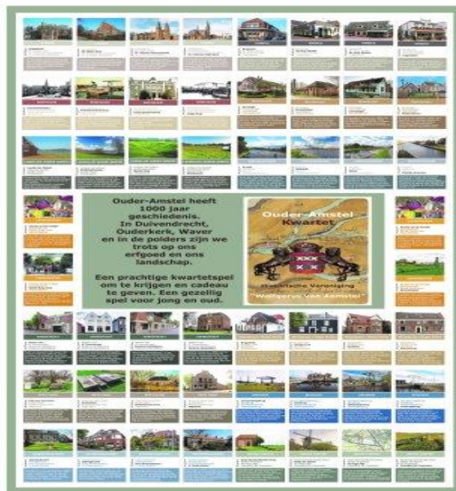
Alle 52 kwartetkaarten

Het bestuur heeft besloten de leden toch een blijvende herinnering aan het jubileumjaar te geven, namelijk een kwartetspel. Dit kwartetspel is ontwikkeld door Mars Out en Alex. Piet de Boer heeft de foto's gemaakt. Het kwartet telt 52 kaarten met 13 rubrieken en is aan de leden aangeboden.